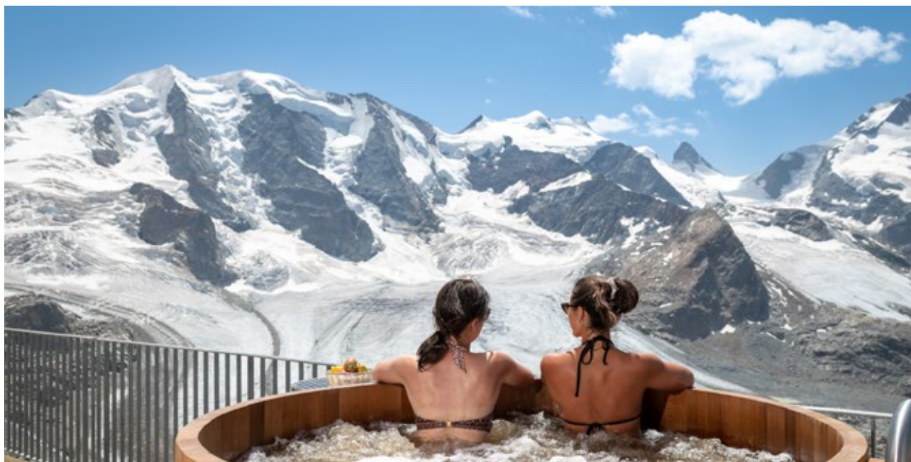
Vasca Jacuzzi vicino al rifugio Berghaus Diavolezza.

Sulla terrazza baciata dal sole, in un angolo un po' appartato, si trova una vasca Jacuzzi . Nell'acqua spumeggiante dalla temperatura gradevole, ci si può riprendere dalle fatiche del giorno, godendo della vista sulle vette di Piz Palü e Bernina.