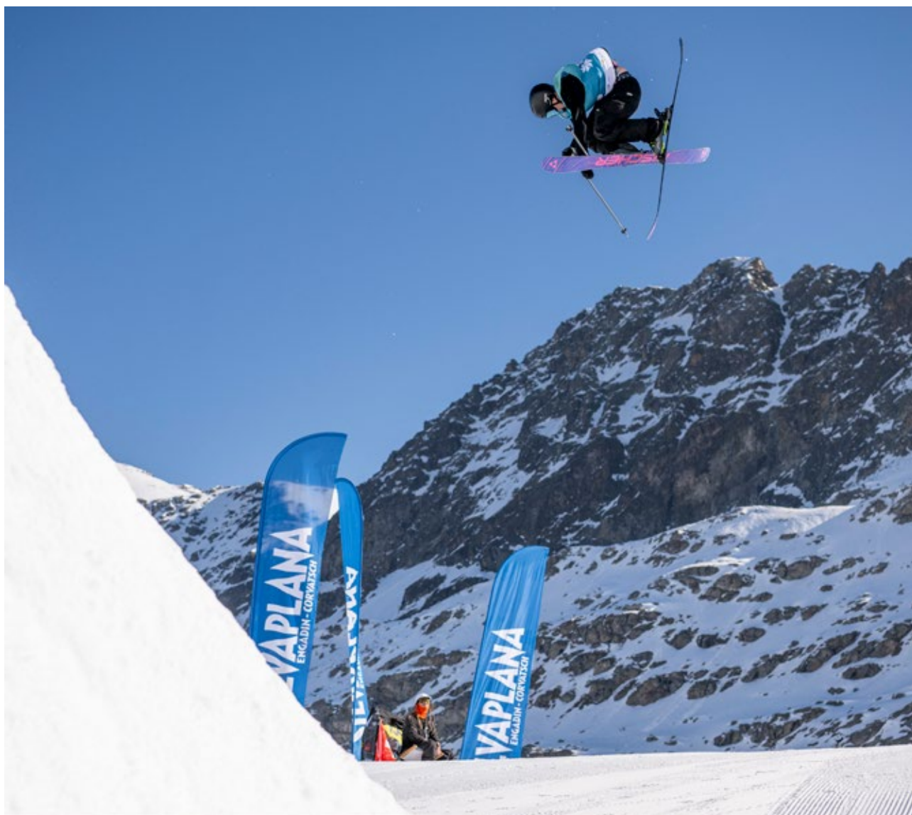
Esibizioni mozzafiato in occasione della Freeski & Snowboard World Cup Corvatsch-Silvaplana.

Dal 17 al 30 marzo 2025, l'Engadina sarà la mecca del freestyle. Sulle piste dei comprensori di Corvatsch e Corviglia andranno in scena i campionati mondiali. Il Corvatsch sarà sede delle gare di Slopestyle e Halfpipe. La società Corvatsch AG è molto lieta di ospitare i campionati mondiali.