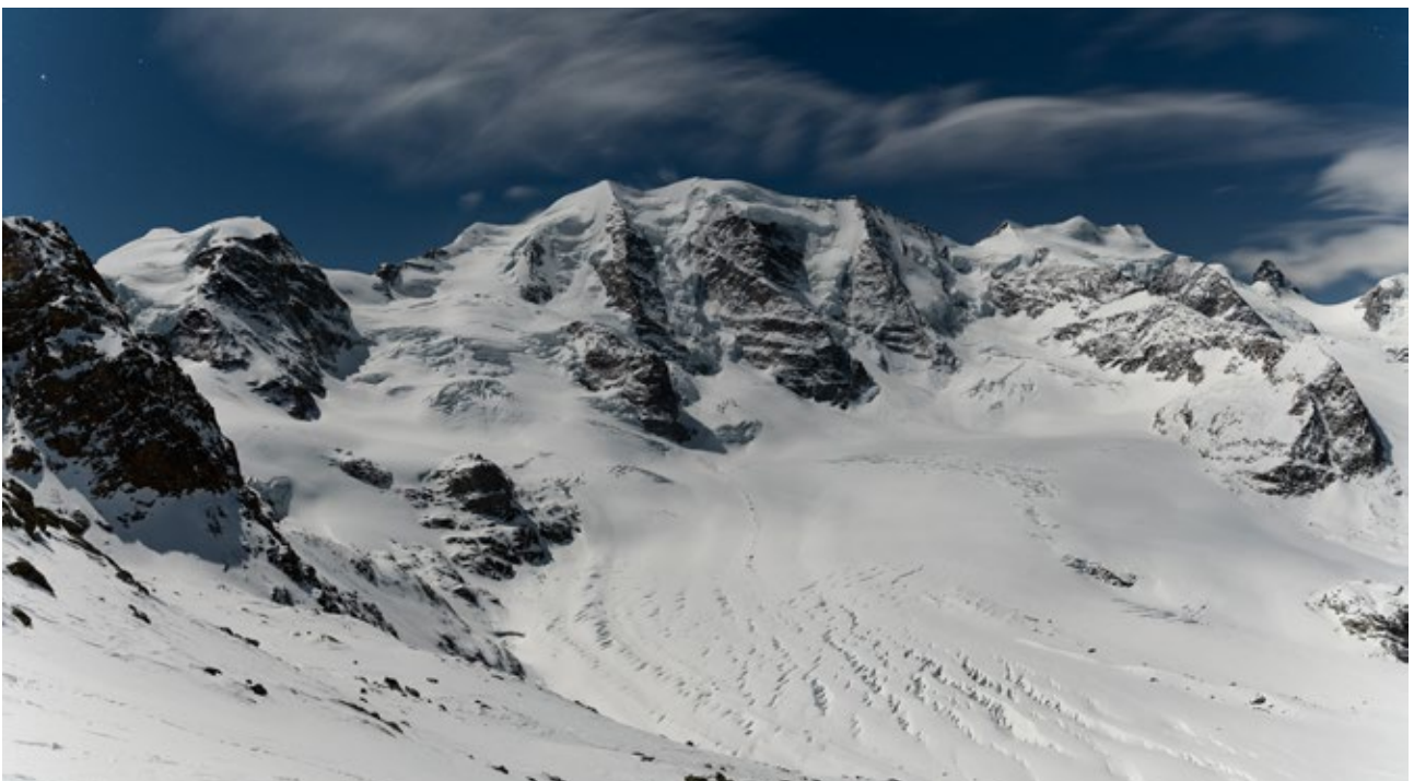
Diavolezza: un panorama incredibilmente bello.

In futuro, la gara dovrebbe avere luogo con ricorrenza annuale. L'evento è pensato non solo per richiamare l'attenzione sul ritiro del ghiacciaio e i mutamenti climatici, ma è prevista anche una campagna di raccolta fondi per un progetto concreto a favore della cura dei ghiacciai.